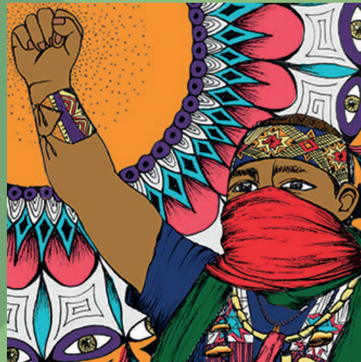
Illustration par Liana Perez

Nous tenons à remercier chaleureusement la Congrégation Notre-Dame, la Caisse d'économie solidaire Desjardins, le Comité UQAM Amérique Latine (QUAL) et l'Association facultaire des étudiant·e·s en sciences humaines de l'UQAM (AFESH) pour leur soutien financier, ainsi que toutes les personnes solidaires ayant contribué à l'une ou l'autre des étapes de ce projet.